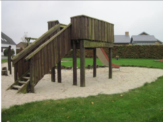
Redskab: Klatreborg Årgang: ? Producent: ? Er redskabet mærket: nej Er der registreret fejl/mangler: ja