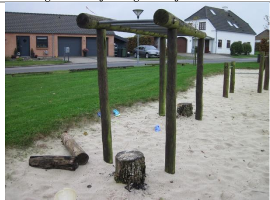
Redskab: Armgang Årgang: ? Producent: ? Er redskabet mærket: nej Er der registreret fejl/mangler: ja