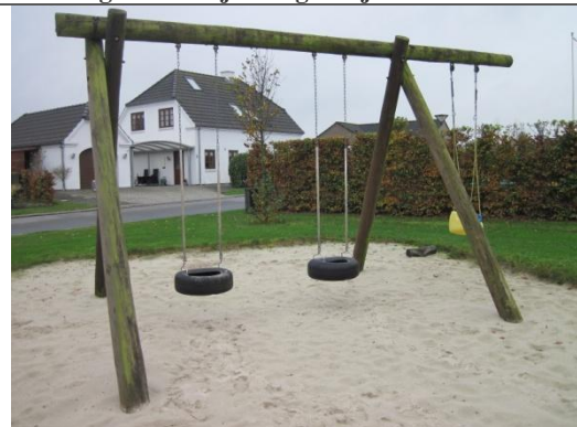
Redskab: Gyngesæde Årgang: ? Producent: ? Er redskabet mærket: nej Er der registreret fejl/mangler: ja