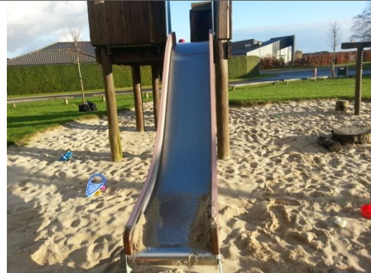
Redskab: Rutsjebane Årgang: ? Producent: ? Er redskabet mærket: nej Er der registreret fejl/mangler: nej