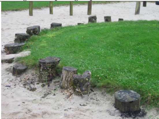
Redskab: Balancestubbe Årgang: ? Producent: ? Er redskabet mærket: nej Er der registreret fejl/mangler: ja