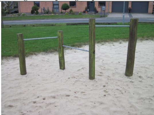
Redskab: Koldbøttestativ Årgang: ? Producent: ? Er redskabet mærket: nej Er der registreret fejl/mangler: nej