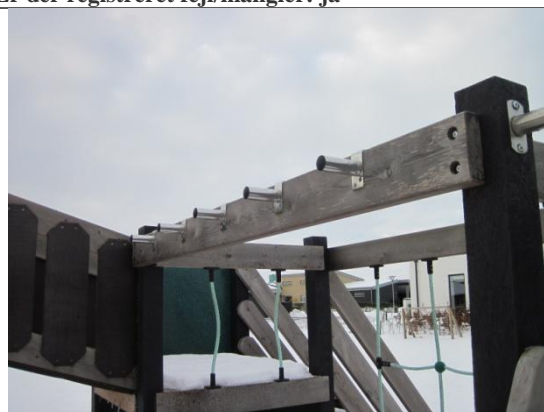
Redskab: Armgang Årgang: 2008 Producent: Ludus Er redskabet mærket: ja Er der registreret fejl/mangler: nej