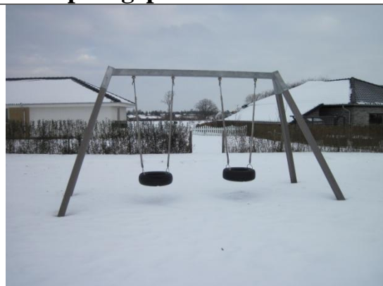
Redskab: Gyng Årgang: ? Producent: ? Er redskabet mærket: nej Er der registreret fejl/mangler: ja