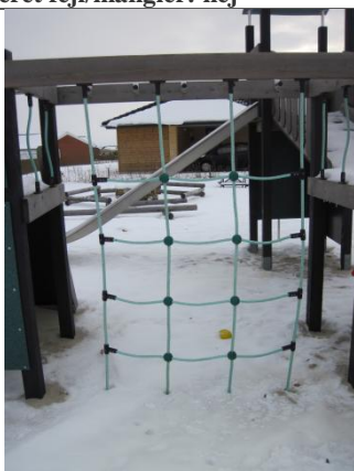
Redskab: Klatre Årgang: 2008 Producent: Ludus Er redskabet mærket: ja Er der registreret fejl/mangler: nej