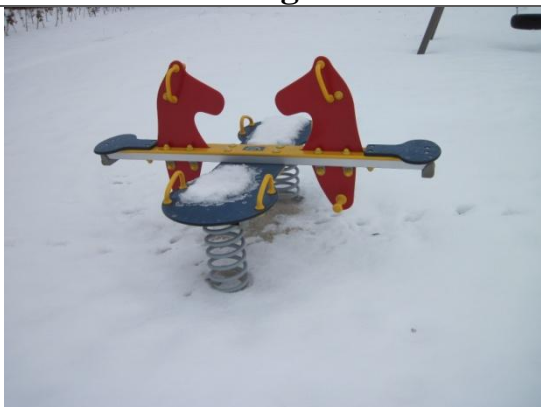
Redskab: Vippe Årgang: ? Producent: ? Er redskabet mærket: nej Er der registreret fejl/mangler: nej