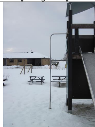
Redskab: Brandmandsstang Årgang: 2008 Producent: Ludus Er redskabet mærket: ja Er der registreret fejl/mangler: nej