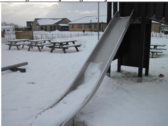
Redskab: Rutsjebane Årgang: 2008 Producent: Ludus Er redskabet mærket: ja Er der registreret fejl/mangler: nej